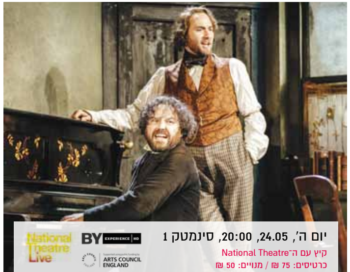
יום ה', 24.05, 20:00, סינמטק 1 קיץ עם ה-National Theatre כרטיסים: 75 ₪ / מנייים: 50 ₪

Dir.: Jean-Gabriel Periot | The mid-1960s saw an awakening of radicalism among students in Germany who lost all faith in the old establishment. They tried to launch a revolution, at first using intellectual and artistic discourse, and eventually, resorted to violent action. Using archival footage, A German Youth offers a sharp and fascinating analysis of this development. (93 min., Fr. & Ger., Eng. & Heb. subt.)