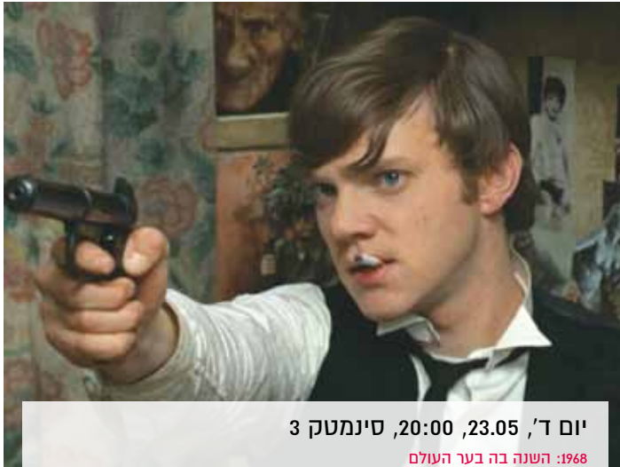
יום ד', 23.05, 20:00, סינמטק 3

Dir.: Savi Gabizon | W.: Moshe Ivgy, Hannah Azulai-Hasfari | A romantic young man who lives with his mother in the slums, falls in love with a blonde actress from Tel-Aviv who comes to live in the area to teach drama. (94 min., Heb. only)