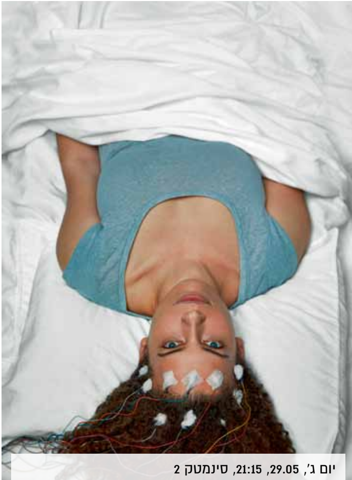
יום ג', 29.05, 21:15, סינמטק 2