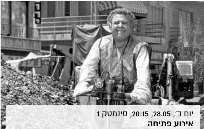
יום ב', 28.05, 20:15, סינמטק 1 אירוע פתיחה